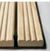
Typ B (ohne Anfahrkeile und Abschrägung)